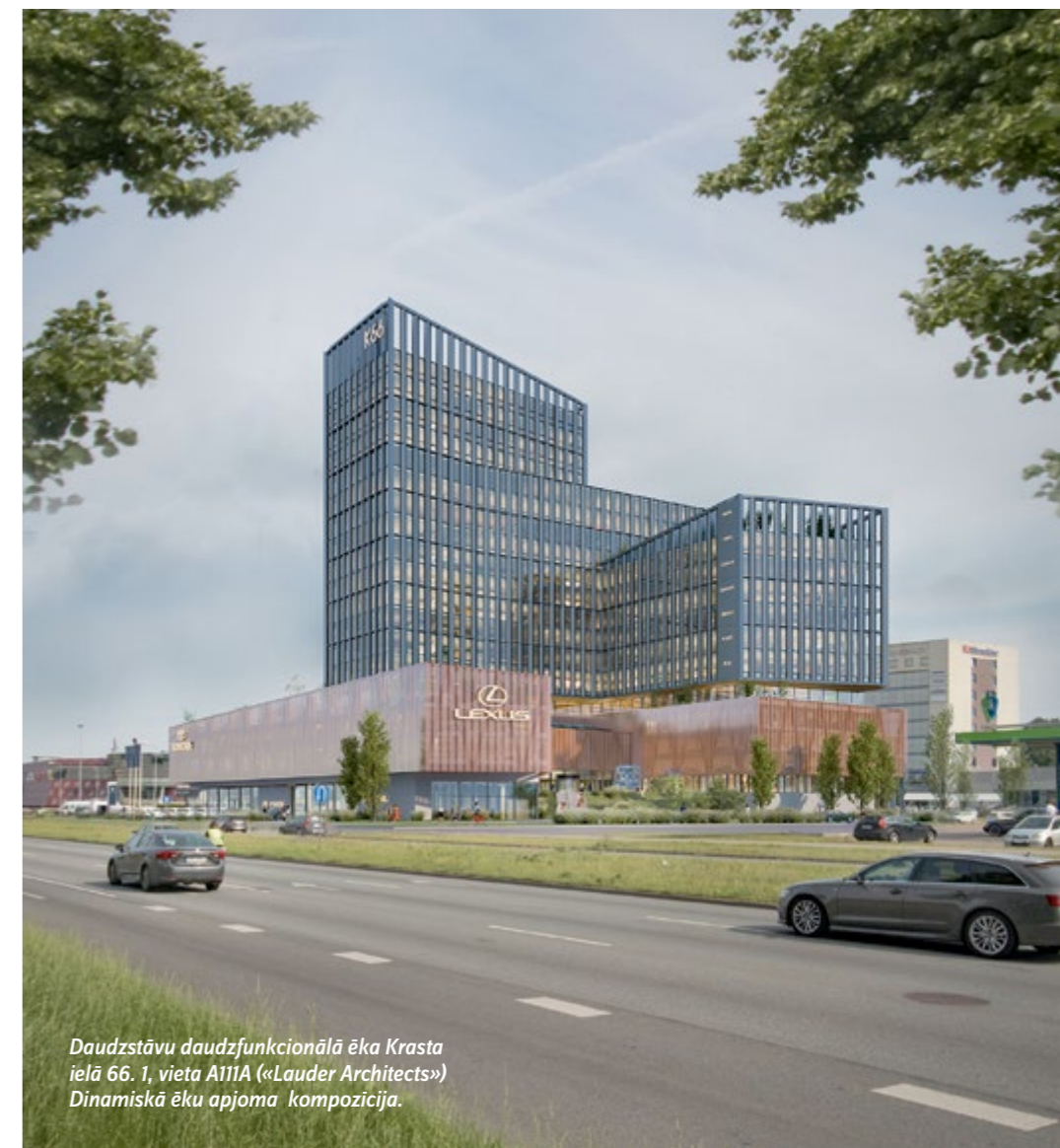
Daudzstāvu daudzfunkcionālā ēka Krasta ielā 66. 1, vieta A111A («Lauder Architects») Dinamiskā ēku apjoma kompozīcija.

Trešo vietu (2000 EUR) piešķir darbam ar devīzi DUN22, autori - «K IDEA». Darbs saņēma vispretrunīgākos žūrijas vērtējumus gandrīz visās pozīcijās un ieguva augstāko vērtējumu sabiedrības balsojumā. Jaunbūve risināta stilistiskā kontrastā ar vēsturisko ēku un ainavu. Tās horizontālais ritms kā kompozīcijas pamatprincips postmodernisma valodā attīstīts līdz formālai līdzībai ar kruīza kuģi, kļūstot par ikonisku tēlu, vizuālu dominanti, parkā ievietotu vides mākslas objektu. Jaunā apjoma fasāžu dalījuma mēroga un virzienu (horizontāles pret vertikālām) kontrasts ir skaidri nolasāms. Virzoties pa plašo pusloka ceļu uz viesnīcas ieeju, vēsturiskā ēka labi aplūkojama no visām pusēm. Piedāvājums veido pieblīvētas vides raksturu, arhitektūras formu valoda ir agresīva. Jaunais apjoms necenšas iekļauties kultūrvēsturiskajā vidē, jaunbūves arhitektūra ir savrupa, tai nav saiknes ar vietas raksturu. Ūdens-tilpju dažādības un daudzuma ekonomiskā un funkcionālā lietderība ir grūti pamatojama. Jumta terases panorāmas baseins ir pievilcīgs, taču dārgs un Latvijas, īpaši Liepājas, vējinājā klimatā ne vienmēr izmantojams risinājums.