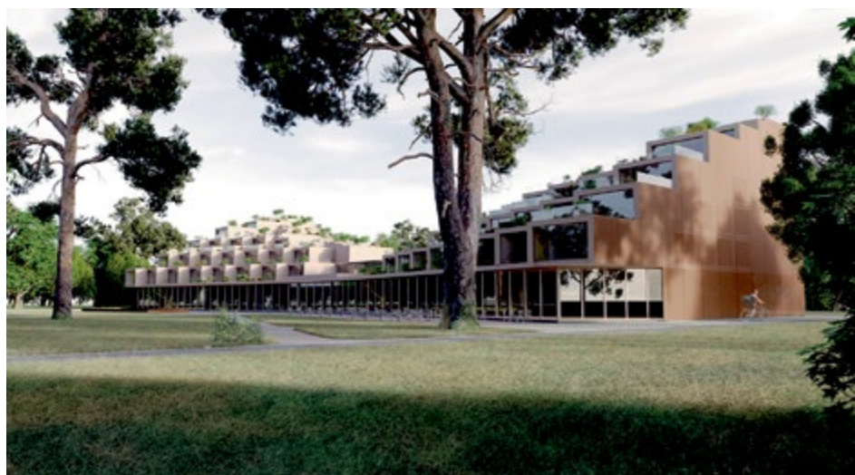
1. vieta SPA22 («ZGT»). Viesnīcas ar SPA kompleksu virsskats.