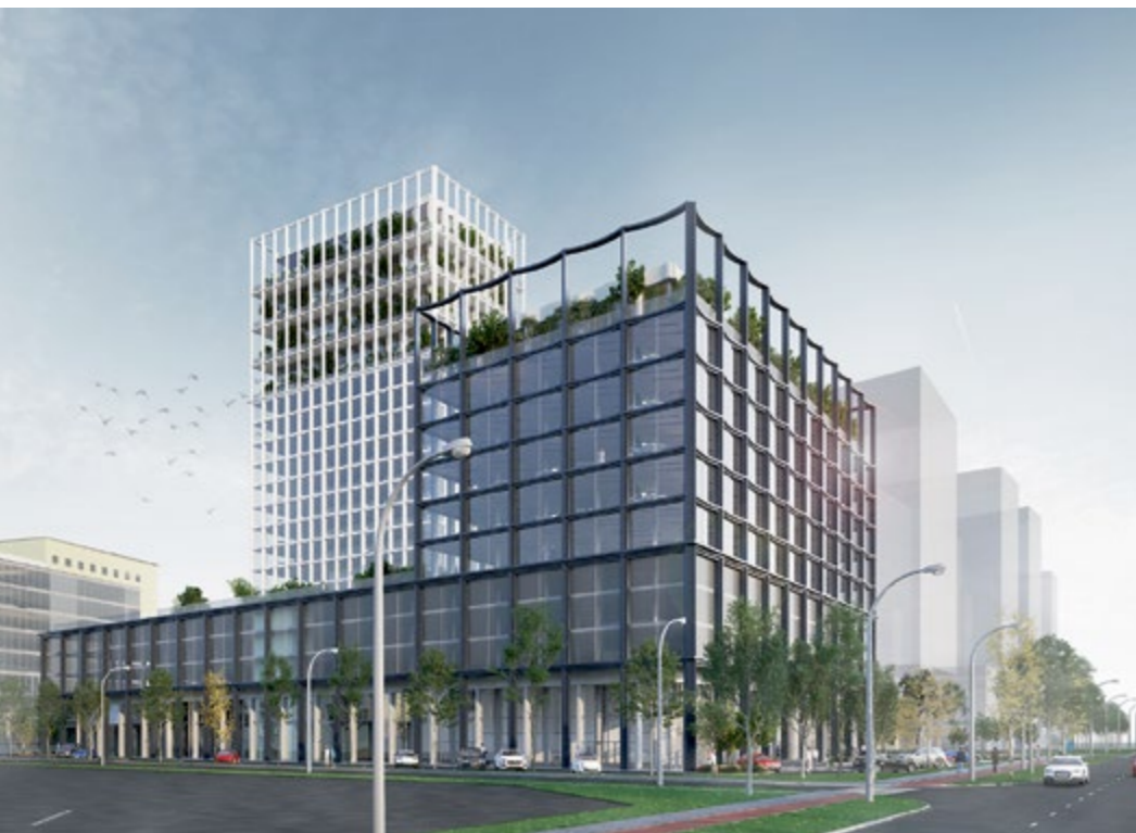
2. vieta MA123 (SIA «a part»). Savietotie baltās un melnās krāsas būvprojomi.