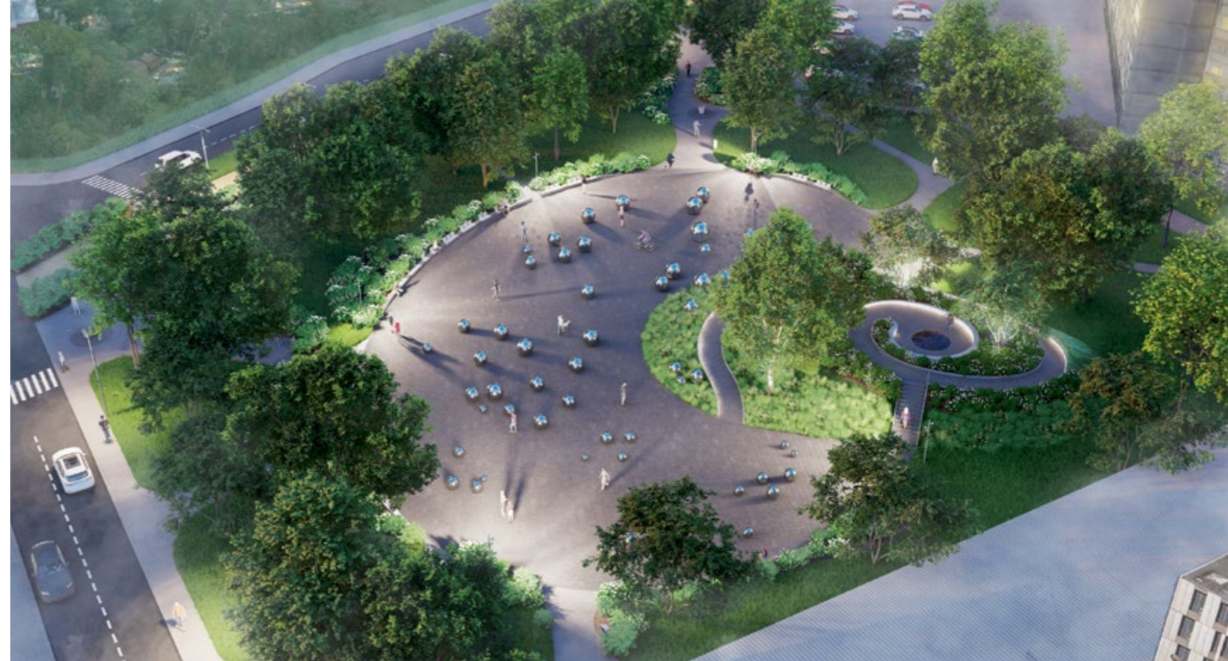
1. vieta GPV2013 (SIA «ALPS ainavu darbnīca») Kopābūšanas laukuma virsskats ar klusuma pakalnu un 54 nerūsējošā tērauda sfērām.

Veicināšanas godalgas (750 EUR) piešķirtas darbam ar devīzi ABC123, autori – piegādātāju