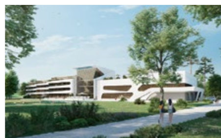
✓ ✓ Pasūtītāja atzinība PMB22 («OUTOFBOX»). Vēsturiskā Pelnu iestāde un jaunais SPA komplekss.